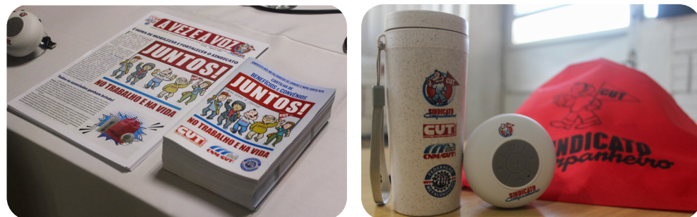
Acima, os materiais da Campanha de Sindicalização de 2022.